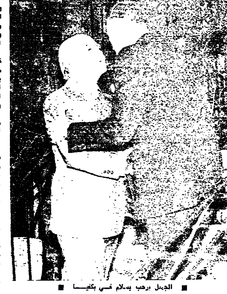
الجميل يربط بسلام في بكفيا

ويطلب الجميع بالولاة للبنان، ورغم انه يقر ويشهد... على الصيغة على الصفحة 8